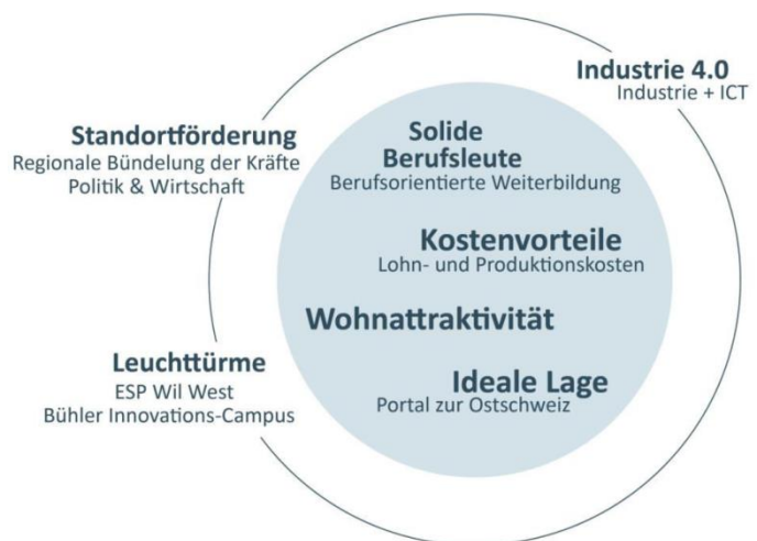
Abbildung: strategische Positionierung

Die Branchenstruktur prägt die regionale Berufsbildungslandschaft und damit auch die beruflichen Qualifikationen der regional verfügbaren Fachkräfte. Das strategische Positionierungsargument Branchenfokus MMDN fokussiert in erster Linie auf den Ausbau und die Weiterentwicklung der bestehenden Strukturen und Stärken und definiert weitgehend auch das Akquisitionspotenzial von Neuansiedelungen.